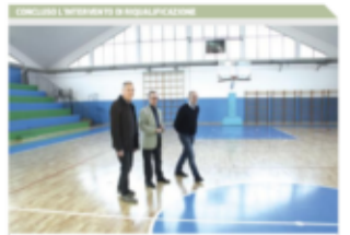
NUOVO LOOK E UN PARQUET ANTI-IMPATTI PER IL PALASPORT