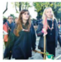
IL VESCOVO ALL'ORATORIO DI SAN BERNARDO PER INAUGURARE LE AULE DEL CATECHISMO

Un trentennio di sviluppo e crescita per il movimento scout lodigiano. Un traguardo che si celebra il 21 febbraio con un evento che si svolgerà a Palazzo Municipale. L'occasione è offerta dalla ricorrenza dei 70 anni di attività del movimento scout lodigiano. Un traguardo che si celebra con un evento che si svolgerà a Palazzo Municipale. L'occasione è offerta dalla ricorrenza dei 70 anni di attività del movimento scout lodigiano.